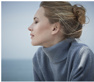
PROGRAMMA CITADINE CITYLIFE